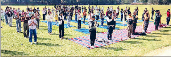
रेवाड़ी। केएलपी कॉलेज में सूर्य नमस्कार का अभ्यास करते हुए।