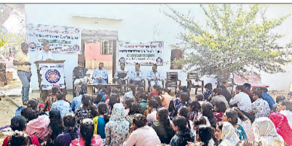
नारनौल। एनएसएस शिविर समापन में मौजूद अतिथि व विद्यार्थी।

स्तर पर अनेक वर्षों से नाटक निर्देशन व अभिनय की बुलाईया छूने पर भारंगम सम्मान से सम्मानित किया गया।