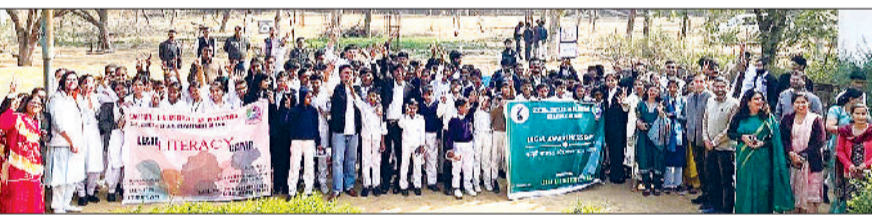
महेन्द्रगढ़। शिविर में प्रतिभागीता करने वाले शिक्षक एवं विद्यार्थी।