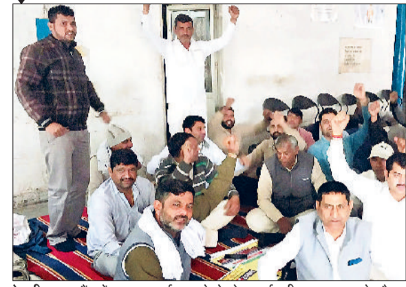
रेवाड़ी। बस स्टैंड में धरना-प्रदर्शन करते रोडवेज कर्मचारी तथा हड़ताल के दौरान सरकुलर रोड पर प्रदर्शन करते हुए स्कीम वर्कर्स।

केंद्रीय ट्रेड यूनियनों, फेडरेशनों, कर्मचारी संगठनों के संयुक्त आह्वान वीरवार को जिले में राष्ट्रव्यापी हड़ताल का मिला-जुला असर देखने को मिला। रोडवेज यूनियन ने चक्का जाम की घोषणा की थी, लेकिन वीरवार को सामान्य दिनों की तरह ही रोडवेज बसें चलती दिखाई दीं। सर्व कर्मचारी संघ हरियाणा से संबंधित हरियाणा रोडवेज वर्कर्स यूनियन की ओर से दो घंटे का विरोध प्रदर्शन किया गया। इस समय अंतराल में बस स्टैंड के गुरुग्राम, महेन्द्रगढ़ व नारनौल रूट के बूथों पर रोडवेज की जगह परमिट की बसें ज्यादा नजर आईं, जिससे यात्रियों को कुछ देर रोडवेज का इंतजार करना पड़ा। भारतीय मजदूर संघ से संबंधित हरियाणा राज्य परिवहन कर्मचारी संघ ने हड़ताल से दूरी बना रखी। बस स्टैंड परिसर में धारा-163 लगने से सुबह से ही पुलिस बल तैनात रहा। इसके अलावा पीएनबी की यूनियन ने हड़ताल का समर्थन किया, लेकिन बैंक कर्मचारी रूटीन में कामकाज