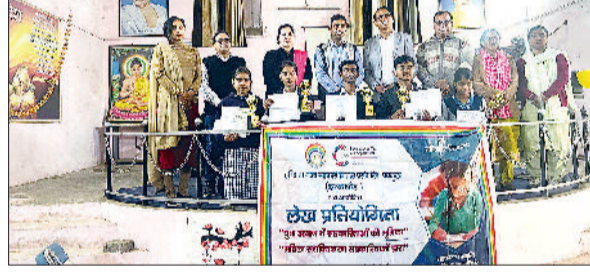
रेवाड़ी। प्रतियोगिता के विजेता शिक्षकों के साथ।