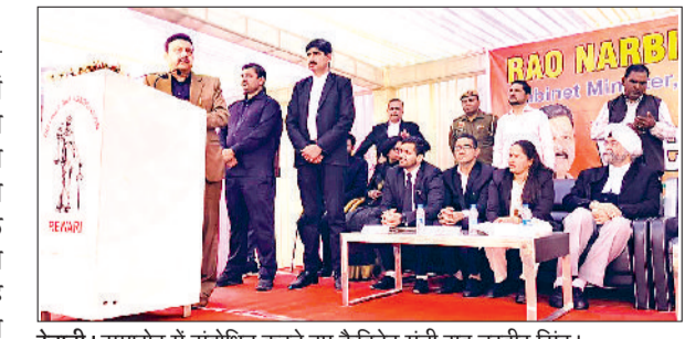
रेवाड़ी। समारोह में संबोधित करते हुए कैबिनेट मंत्री राव नरबीर सिंह।

संगठन को अनुदान दिलवाने का आश्वासन दिया। उन्होंने कहा कि एक उद्योग मंत्री होने के नाते उनका लगातार प्रयास है कि हरियाणा के ग्रामीण व शहरी क्षेत्रों में नए औद्योगिक सेक्टर विकसित हो। इसी उद्देश्य से उन्होंने रेवाड़ी जिले में एक आईएमटी को