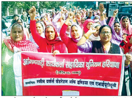
कोटी : हरिभूमि