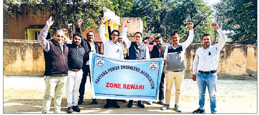
रेवाड़ी। प्रदर्शन करते हुए बिजली निगम के अधिकारी।