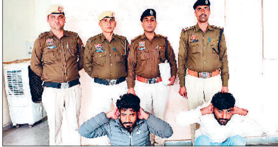
रेवाड़ी। पुलिस की गिरफ्त में दोनो आरोपी।