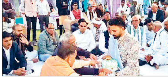
रेवाड़ी। लगन समारोह में रसम अदा करते हुए।