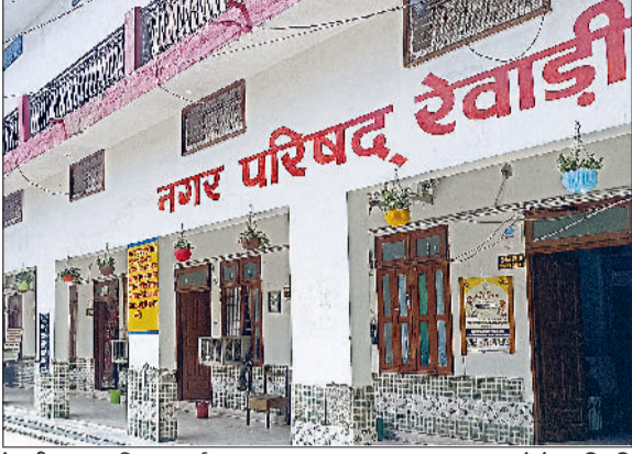
रेवाड़ी। नगर परिषद कार्यालय।