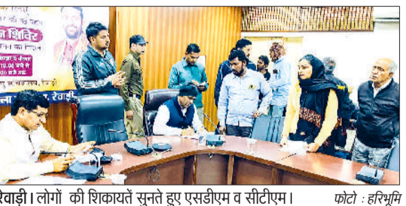
रेवाड़ी। लोगों की शिकायतें सुनते हुए एसडीएम व सीटीएम।