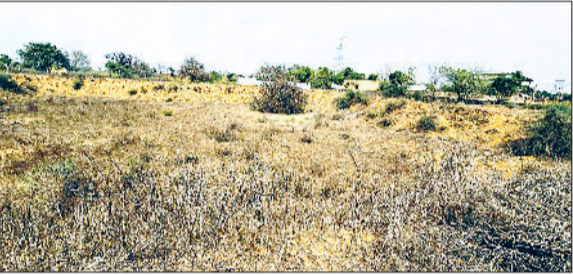
महेन्द्रगढ़। इस जगह पर बनाई जाएगी वाटर बाँड़ी।