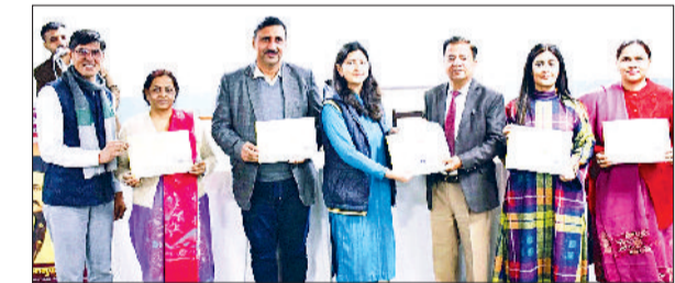
रेवाड़ी। कार्यक्रम में विवरणिका का विमोचन करते हुए।